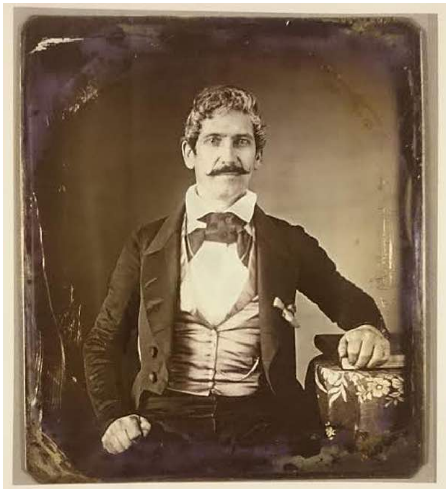
Figure 1 Le premier daguerréotype argentin conservé.