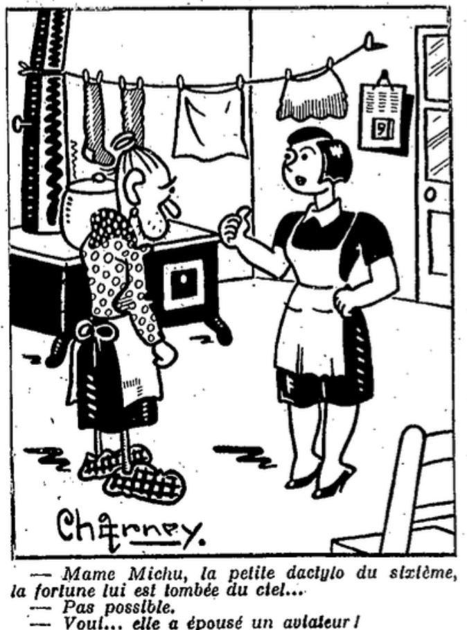
(Fig.1). Illustration de Midinette sur la valorisation de la figure de l'aviateur

Midinette , n° 584, 28 janvier 1938, p.25.